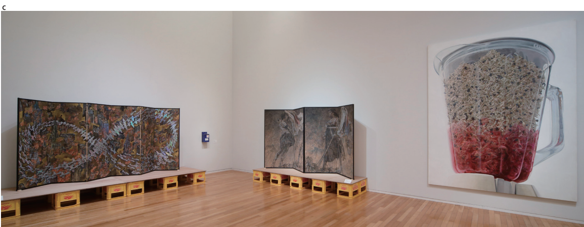
c 会田誠作品 Photo: KIOKU Keizo ©AIDA Makoto

※本リリース掲載図版はすべて「高橋コレクション展 ミラー・ニューロン」の展示風景です。