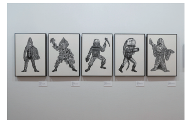
風間サチコ《列島改造人間》シリーズ、2002 Photo: KIOKU Keizo ©KAZAMA Sachiko