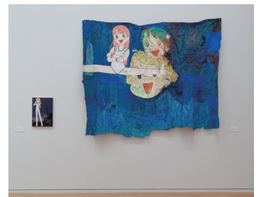
Mr. 作品 Photo: KIOKU Keizo ©2002 Mr./Kaikai Kiki Co., Ltd. All Rights Reserved.