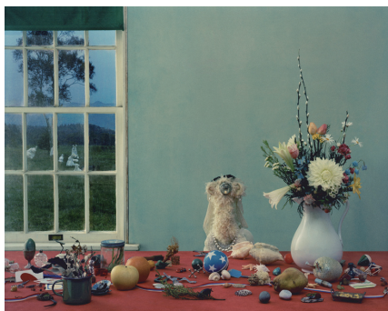
GRACE "Gems" 2008