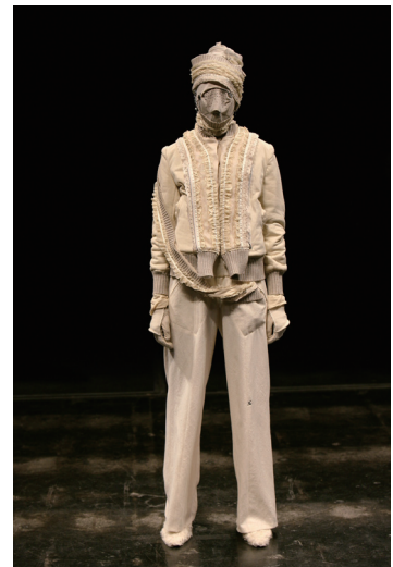
2006-2007 A/W "GURUGURU"