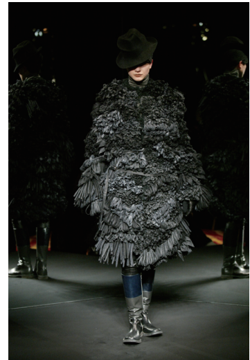
2005-2006 A/W "Arts and Crafts"