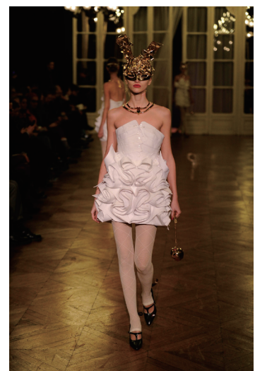
2013-2014 A/W "Anatomicuture"