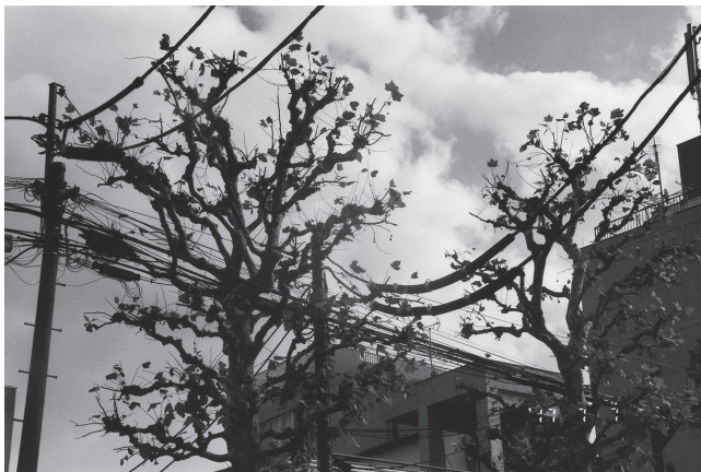
《写狂老人A日記 2017.7.7》 2017