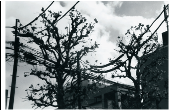
《写狂老人 A 日記 2017.7.7》 2017