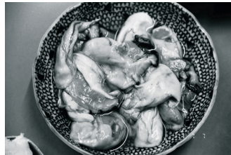
《写狂老人 A 日記 2017.7.7》 2017