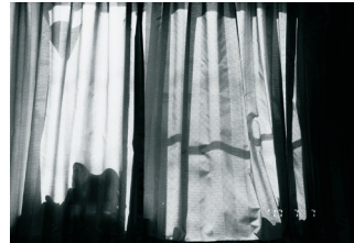
《写狂老人 A 日記 2017.7.7》 2017