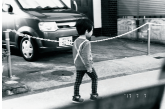
《写狂老人 A 日記 2017.7.7》 2017

荒木のライフワークである「日記」シリーズの最新作。700点近い作品は日付表示がすべて今年の7月7日に操作されています。7月7日は今は亡き妻、陽子との結婚記念日です。日常を淡々と、恣意的な要素を排して捉えており、撮られた順序そのままに展示されます。人生を彩る「時間」の流れと、なにげない日常のなかにかいま見える生と死のテーマが、鮮やかに浮かび上がります。