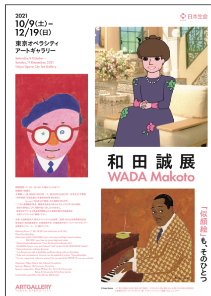
和田誠展 ティザーフライヤーなど