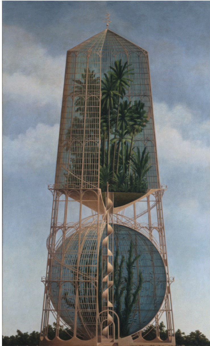
《Forthcoming Place-5 来たるべき場所 5》1996 アクリル絵具、キャンパス 162.2 x 97.2cm 作家蔵

目の前に広がる見知らぬ風景に、不思議な構築物がそびえ立つ。なぜか懐かしさを感じさせる野又穫（のまた みのる 1955-）の絵画は、架空の光景と一言で片付けることのできない、現実と地続きにある非現実とでもいうべき独特の世界が特徴です。当館コレクションの寄贈者・寺田小太郎氏は野又の作品をこよなく愛し、1980年代から毎年収集を続け、代表作40点あまりが収蔵される最大の所蔵館となりました。