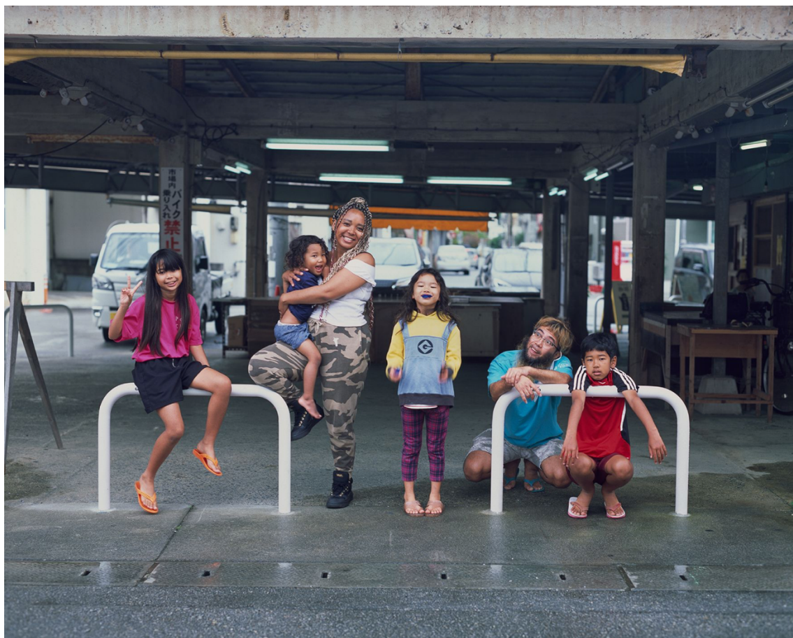
〈大琉球写真絵巻 パート9〉より 沖縄でバイレイシャル(ミックスルーツ)として生きること 2021

沖縄を拠点としながら精力的な制作活動続ける写真家・石川真生（1953-）の初期からの主要な作品を始め、とりわけ2014年から取り組んでいる「大琉球写真絵巻」の新作を中心に展示し、石川真生の実像に迫る個展を開催します。